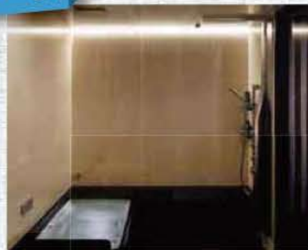
バスルーム スパーージュ

なかなか外出できない今だから、おうちでゆったりリフレッシュ。最高のくつろぎを堪能しませんか。