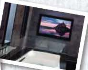
テレビ付きお風呂