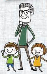
トイレ サティス Gタイプ