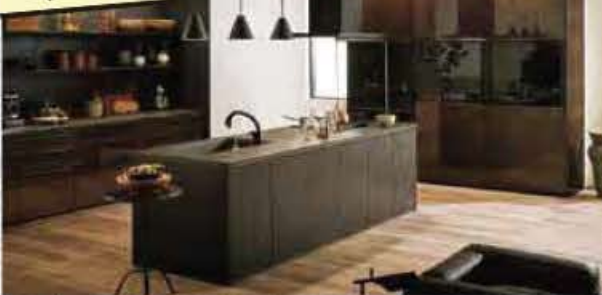
キッチン リシェール